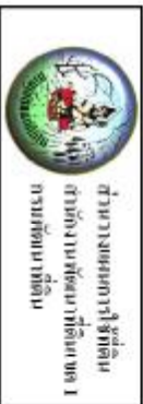
รูปที่ 3-3 แผนที่การใช้ที่ดิน ตำบลนาเกลือ อำเภอกรวย จังหวัดนครนายก